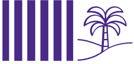
Tabella di marcia e prossime scadenze