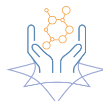
HEALTHY AGING E MEDICINA RIGENERATIVA