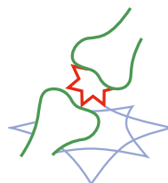
MEDICINA DEL DOLORE/ORTOPEDIA/ REUMATOLOGIA