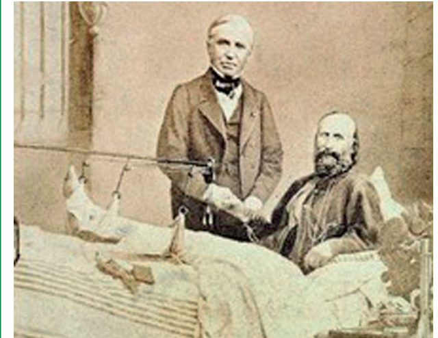
Garibaldi ferito sull'Aspromonte, 29 agosto 1862

La fissazione esterna della gamba in traumatologia e nelle sequele post-traumatiche